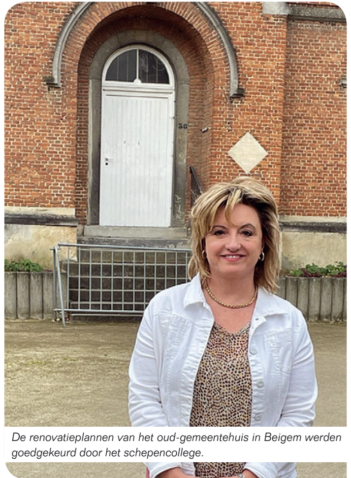
De renovatieplannen van het oud-gemeentehuis in Beigem werden goedgekeurd door het schepencollege.

Vanaf dit jaar heb ik het genoegen voorzitter te mogen zijn van de Intergemeentelijke Onroerenderfgoed-dienst "Erfgoed Brabantse Kouters" waar we met 12 gemeenten samenwerken rond onroerend erfgoed, archeologie en landschappelijk erfgoed. Dit samenwerkingsverband werd vorig jaar erkend door