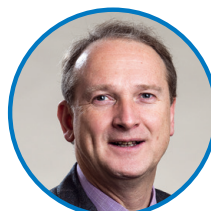
Bart Laeremans Burgemeester

Heel jammer vinden we de houding van diezelfde oud-collega's als het gaat over de luchthaven. Met de vijf noordrandgemeenten wilden we een krachtig en eendrachtig signaal sturen naar de hogere overheid, met de boodschap dat gezondheid mee moet tellen bij het luchthavenbeleid boven onze streek. Op dit moment zijn er pogingen aan de gang om zeker tijdens de nacht alle hinder boven de Noordrandgemeenten te concentreren. Mogen we aan de partij van de premier vragen om eindelijk op te komen voor onze streek?