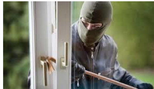
Inbraken in woningen 2012 - 2015